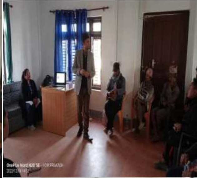
OnePlus Nord N20 SE - MOM PRAMASH 2023/12/08 14:57