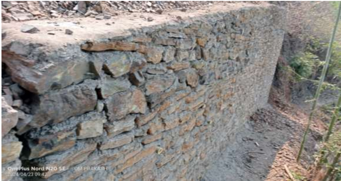
OnePlus Nord N20 5G | OM PRAKASH 24/04/23 09:47