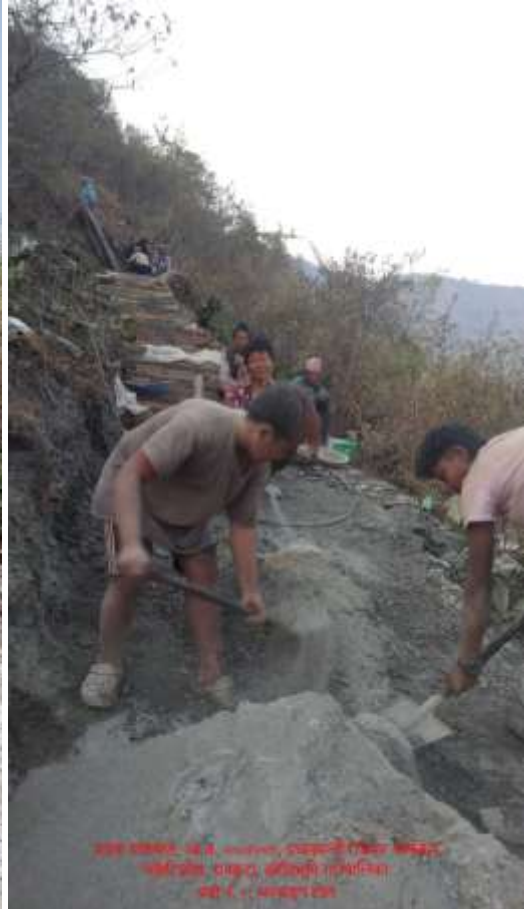
(3) भञ्जयाड चन्द्रोदय प्रावि सुन्तलाबारी जाने गौरेटो बाटो रु११४८९६ र रु ६००००। जम्ममा रु १,७४,८९६।