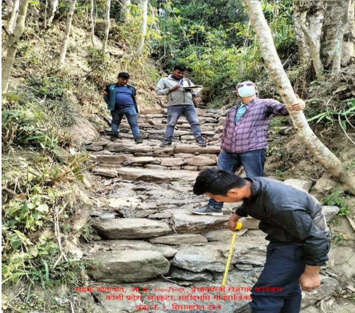
संकेत खातावात, आ.सं. २०६०/२०६१, प्रस्तावमंजुरी रोजगार कार्यक्रम कोशी प्रदेश, धनकुटा, सहीदभूमि गा.सं.पालिका अवधि: ३, सिरानटोल टोल