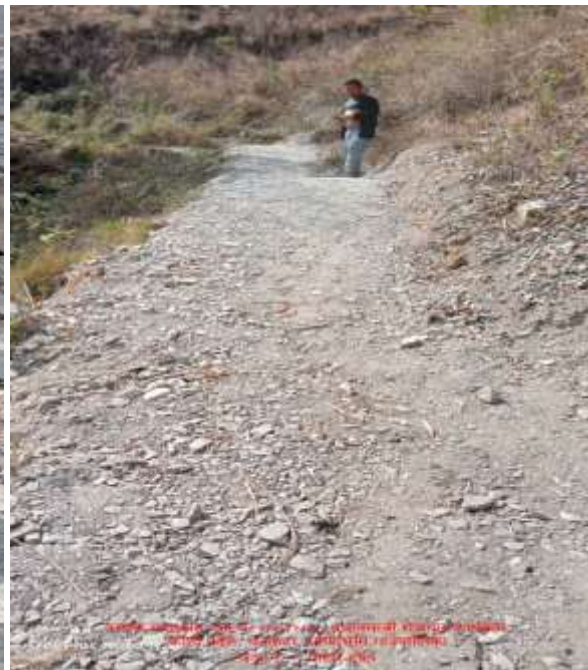
(२) पोखरे सिम्मले त्रिवेणी जाने गोरेटो बाटो रु २८७२४० र १००००० जम्ममा रु ३८७२४०।