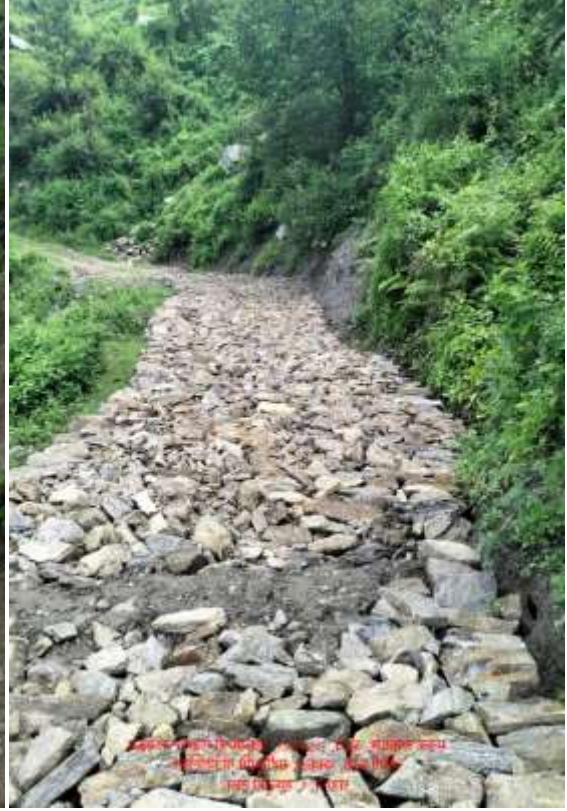
वडा ६ मा ३ वटा (१) खुन्दुकी डम्फे सानो माम्फिड सडक सोलिड रु ४००८००।