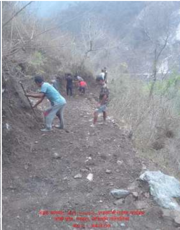
(१) कर्कलेआर्दश मावि जाने गोरेटो बाटो रु ४००८००।