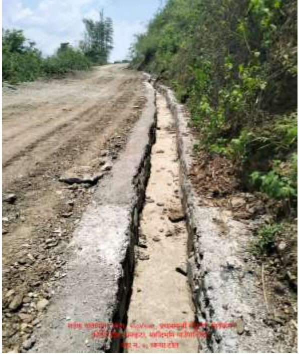
(२) चाम्चासाष्टिड ड्रेन तथा सडक मर्मत रु ५१७०३२ र २०००००। जम्ममा रु ७,१७,०३२।