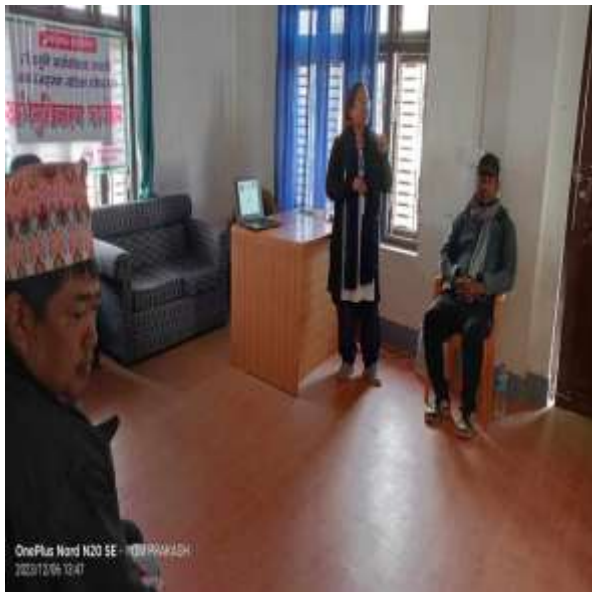
OnePlus Nord N20 SE - MOM PRAMASH 2023/12/08 12:47