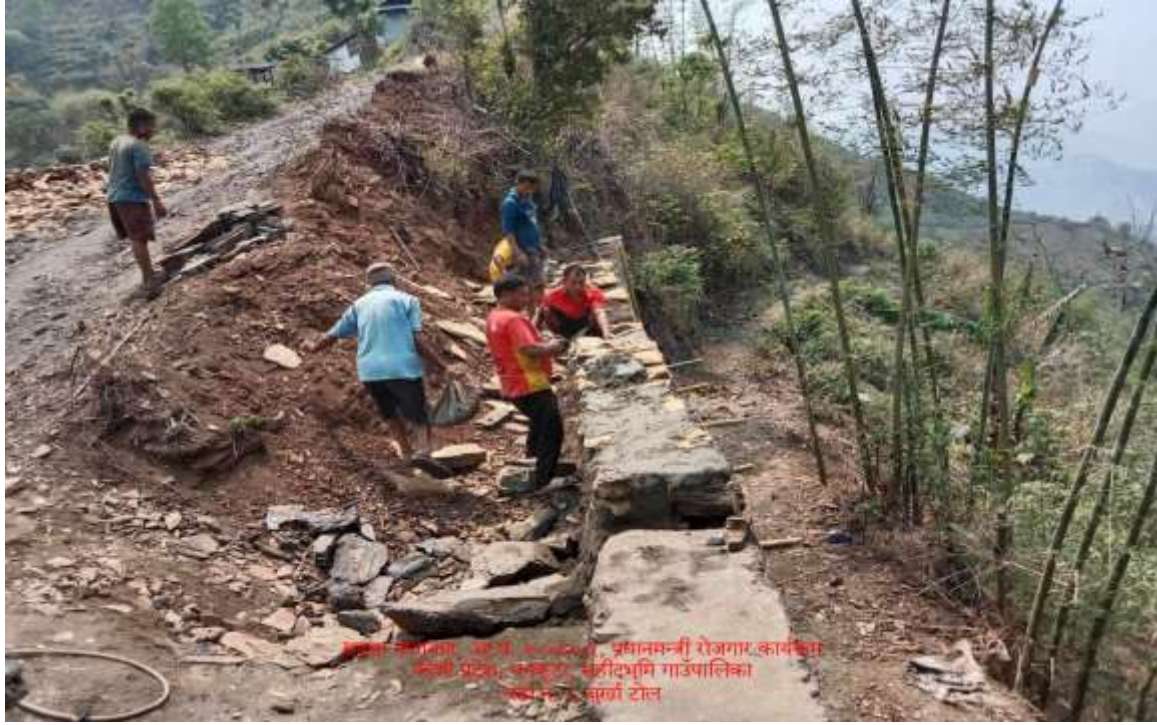
सुदूरपश्चिम प्रदेश, कैलाल जिल्ला, प्रधानमन्त्री रोजगार कार्यक्रम केही प्रस्ताव अनुसार, सुदूरपश्चिम गाउँपालिका को सुदूरपश्चिम वार्डमा टोल