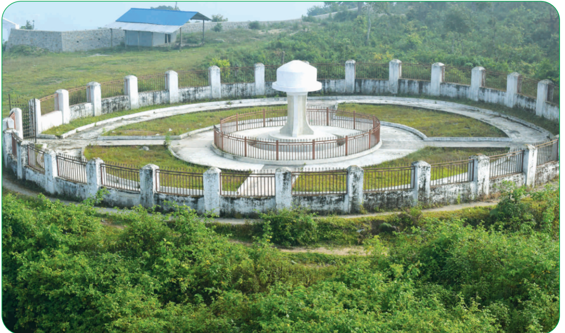
पाताल सहिद स्मारक पार्क