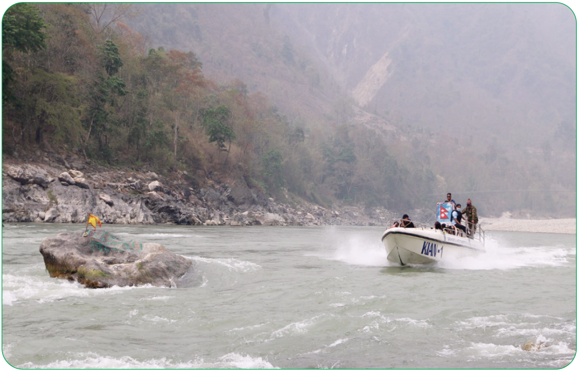
सहिदभूमिको त्रिवेणी दोभान, खुवालुङ क्षेत्र (१४८ मि.)